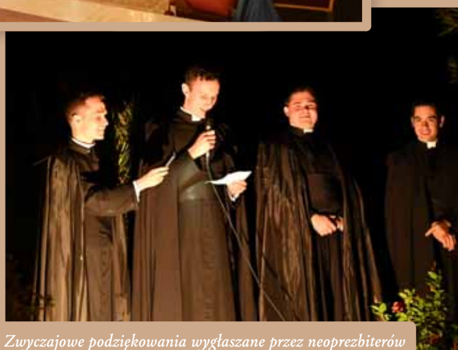
Zwyczajowe podziękowania wygłaszane przez neoprezbiterów