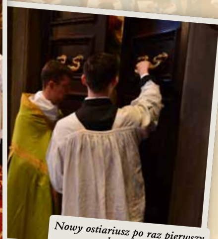
Nowy ostiariusz po raz pierwszy wykonuje swoją posługę