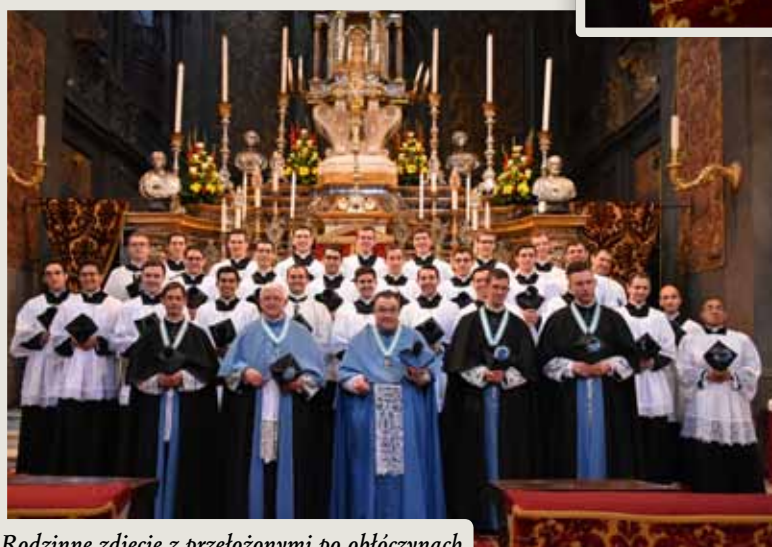
Rodzinne zdjęcie z przełożonymi po obłóczynach