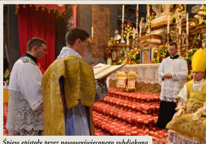
Śpiew epistoły przez nowowyświęconego subdiakona