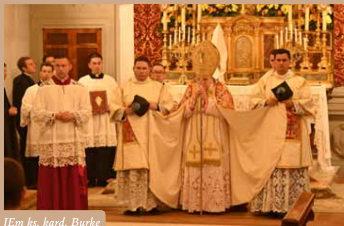
Em ks. kard. Burke

C OROCZNA KAPITUŁA GENERALNA INSTYTUTU zgromadziła pod koniec sierpnia tego roku prawie wszystkich księży kanoników w naszym seminarium! Uroczyste ceremonie oraz konferencje przeplatały się ze spotkaniami w rodzinnej atmosferze.