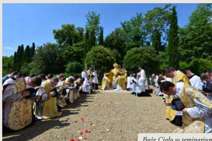
Boże Ciało w seminarium

Liturgię. W niedziele i święta mamy szczęście uczestniczyć w Solennej Mszy Świętej, a funkcje liturgiczne są szczegółowo przyswajane i wielokrotnie ćwiczone, z kolei klerycy zakrystianie pracują nad jak najpiękniejszym przygotowaniem ceremonii.