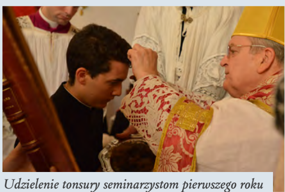
Udzielenie tonsury seminarzystom pierwszego roku

Następnego dnia, w święto Najdroższej Krwi Jezusa Chrystusa, we Florencji, 8 diakonów zostało wyświęconych na kapłanów in aeternum poprzez nałożenie rąk księdza kardynała. Kiedy otrzymywali władzę odprawiania Mszy świętej, każdy z nich mógł medytować nad tym, co ich powołanie nakazuje w kategoriach wymagań i wyrzeczeń. Podobnie jak Chrystus, „kapłan jest człowiekiem ukrzyżowanym” (O. Chevrier OSB). Za przykładem Jezusa zechcieli oni oddać się bez reszty na chwałę Bożą i zbawienie dusz ludzkich. „Komu wiele dano, od tego wiele wymagać się będzie” (Łk 12,48), módlmy się więc za nich z całego serca i składajmy ofiary, aby zawsze byli wierni łasce Bożej.