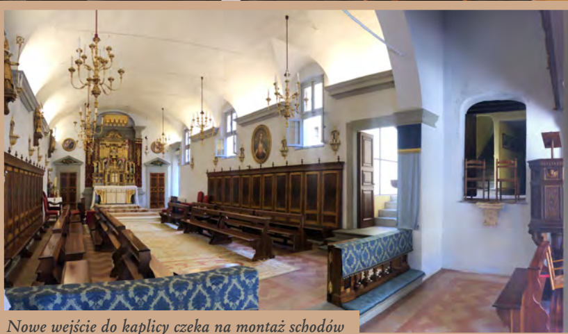
Nowe wejście do kaplicy czeka na montaż schodów

J EST NAS CORAZ WIĘCEJ — PONAD 100 SEMINARZYSTÓW w tym roku, w tym 9 Polaków! Nawet jeśli wielu z nich wyjedzie, aby studiować i pomagać kapłanom w naszych apostołatach, seminarium musi przyjąć więcej osób.