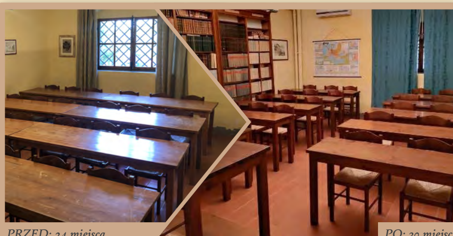
PRZED: 24 miejsca

Ale jak sprawić, by sale wykładowe pomieściły tylu uczniów? Aby rozwiązać ten problem, musieliśmy zdemontować, przepiłować i ponownie zmontować wszystkie ławki w klasach. Dzięki temu mogliśmy zwiększyć liczbę ławek, a tym samym liczbę miejsc siedzących. Wszystko jest gotowe na rekolekcje i nowy rok akademicki!