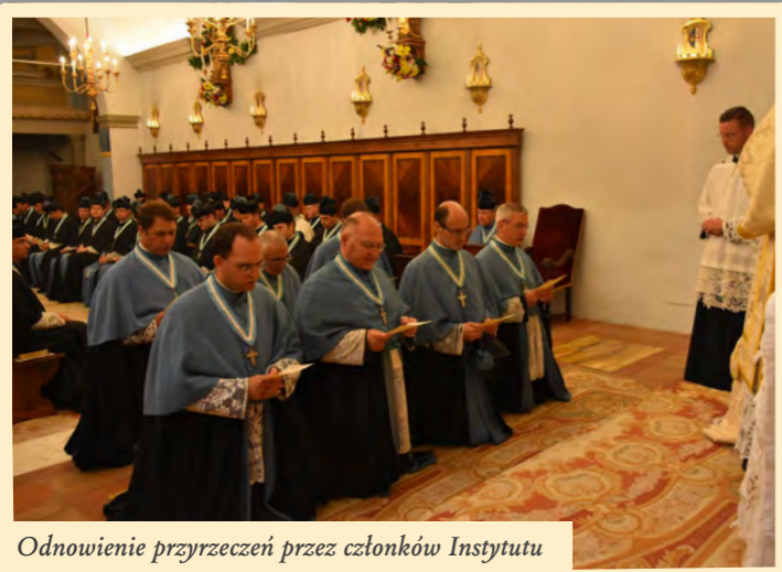
Odnowienie przyrzeczeń przez członków Instytutu