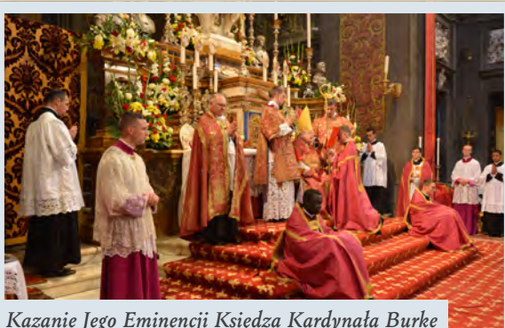
Kazanie Jego Eminencji Księdza Kardynała Burke