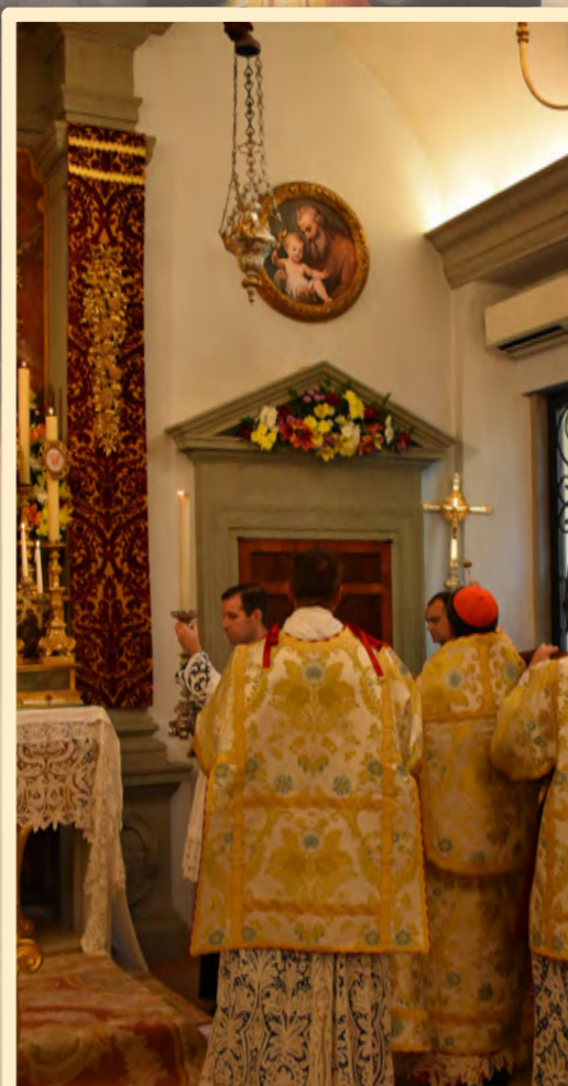
Błogosławieństwo obrazu św. Józefa przez JE ks. kard. Betori'ego