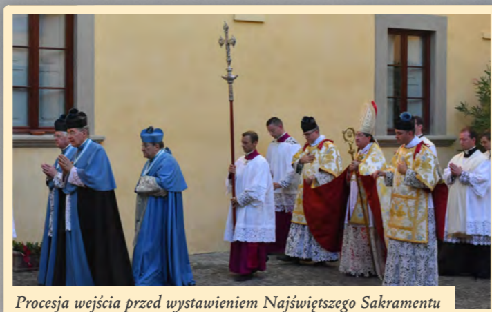
Procesja wejścia przed wystawieniem Najświętszego Sakramentu